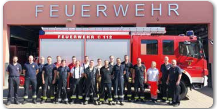
Abschluss der Modularen Truppausbildung (MTA) am 15.07.2023 in Bad Rodach

Seit vielen Jahren arbeiten die Freiwilligen Feuerwehren aus Bad Rodach, Meeder und Lautertal im Bereich der Standortausbildungen Erfolgreich Hand in Hand. Dies stellten Sie auch dieses Jahr wieder unter Beweis. Insgesamt wurden 95 Feuerwehrkameradinnen und Kameraden zu den Standortlehrgängen „Modulare Truppausbildung, MTA-Abschlussprüfung (Trupfführerprüfung), Digitalfunk-MTA-Modul, Maschinisten für Tragkraftspritzen und Löschfahrzeuge und Atemschutzgeräteträger“ ausgebildet.