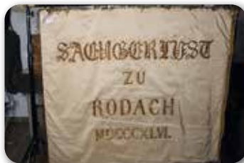
Fahne zum Sängerfest 1846

Das 19. Jahrhundert, zwischen Französischer Revolution und Erstem Weltkrieg, prägte in den deutschen Staaten insbesondere durch die Revolution 1848 eine neue Weltordnung. Die Grundlagen des demokratischen Systems wurden gelegt. Dieses Jahrhundert ist auch die Epoche der Bildung des Vereinswesens, in der neue Organisationsformen mit gemeinsamen Handeln der Bürger geschaffen wurden. Auch in Rodach wurden in dieser Zeit mehrere Vereine gegründet.