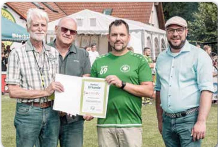
E-Jugend FC Bad Rodach und TSV Aubstadt