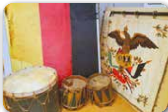
Fahne des Kriegervereins 1871

Der wahrscheinlich erste war ein Gesangsverein, der bereits 1846 ein Sängerfest zu Rodach ausrichtete. Wenig Jahre später, 1860, wurde der Turnverein Rodach gegründet. Die erste Fahnenweihe fand 1865 statt. Diese Fahne ist leider nicht mehr vorhanden. 1891 stifteten die Jungfrauen die o.a. neue. 1871 konstituierte sich der Kriegerverein, der sich Geselligkeit, aber auch die Unterstützung der Kriegsveteranen zum Ziel gesetzt hatte.