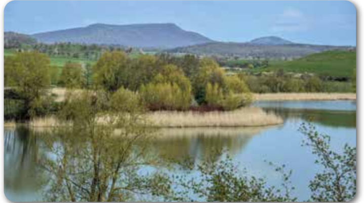
2 Gleichberge und der Stausee Westhausen