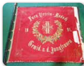
Fahne des Turnvereins von 1891

Die neuen Objekte können jeden Sonntag von 14.00 – 16.00 Uhr im Heimatmuseum, Schloßplatz 5 besichtigt werden. Der Eintritt ist frei!