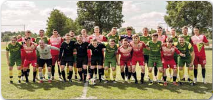
Herren TSV Aubstadt und FC Bad Rodach

Bei diesem perfekt organisierten Event stand ausnahmsweise das Sportliche nicht im Vordergrund, der TSV Aubstadt siegte souverän mit 13:0 und ließ dem heimischen FC nicht die Spur einer Chance. Im Vorspiel der E-Junioren beider Mannschaften behielt allerdings der FC mit 2:1 die Oberhand.