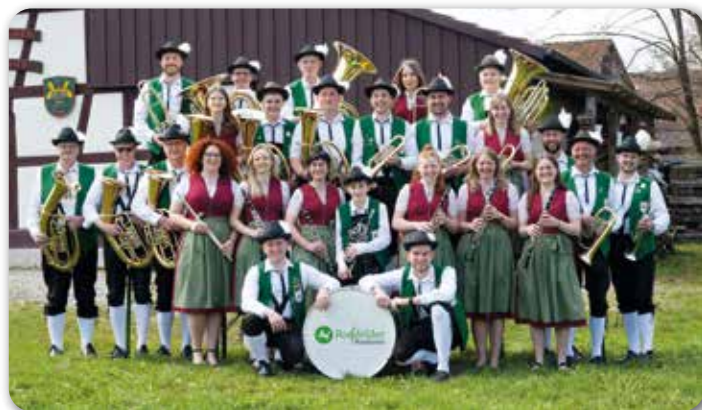
So jung ist Blasmusik: Die „Roßfelder Musikanten“ wurden 70!