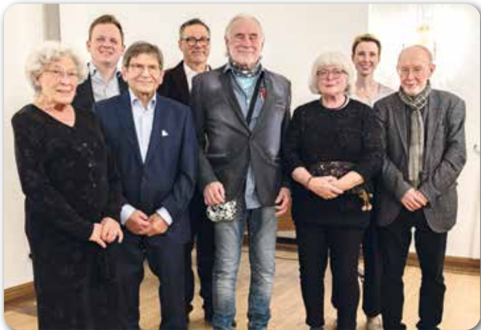
Die vier Gründungsmitglieder mit den drei Bürgermeistern und dem Vorsitzenden auf dem Festakt

Die 50 Jahre Vereinsarbeit stehen im Mittelpunkt des Festaktes im Großen Festsaal des Bad