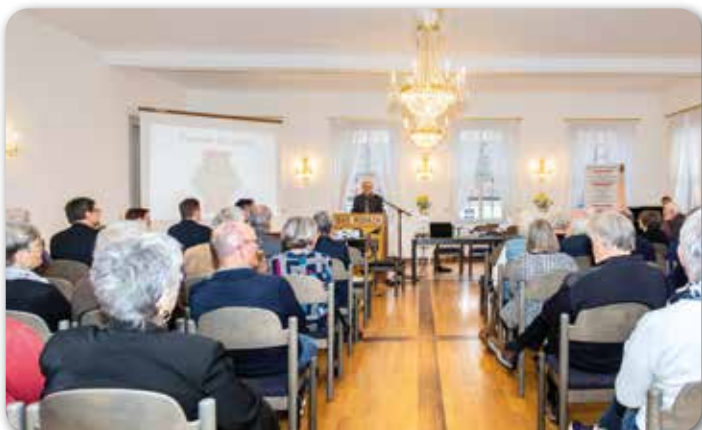
Der Festakt am Freitag

Rodacher Jagdschlusses am Freitagabend. Musikalisch untermalt von Markus Ewald am Flügel schildern drei Kurzvorträge in Wort und Bild Schwerpunkte und Aktivitäten. Ein Hauptziel des Vereins kann schon nach ersten Zwischenlösungen 1982 erreicht werden: ein eigenes Heimatmuseum im Dachgeschoss des Jagdschlusses. Grundlage des Betriebs bildet seitdem eine Vereinbarung mit der Stadt Rodach, die dem Verein die Trägerschaft und Betreuung übergibt. Dies unterstreicht die gute und enge Zusammenarbeit zwischen Stadt und Verein. Neben regelmäßigen Öffnungszeiten finden immer wieder Sonderaktivitäten durch Ausstellungen und die jährliche Rösler-Börse mit diesem Rodacher Feinsteingut statt.