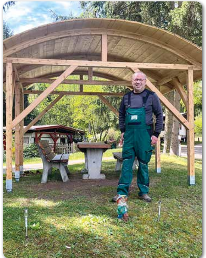
Camping unter Dach: Der neue Pavillion

Und dann geben uns die beiden noch einen Satz mit auf den Weg, der für diesen besonderen Platz wie geschaffen gilt: „Camper halten zusammen!“