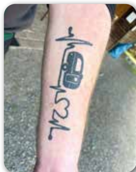
Camping geht „unter die Haut“

Von April an bis Ende September wohnen sie direkt am Waschhaus im eigenen Wohnwagen. Die „Anmeldung“ ist sozusagen ganztags geöffnet. Ganz neu seit Februar ist ein Pavillon, der für 8 Personen Platz und Dach findet. Sozusagen gestif-