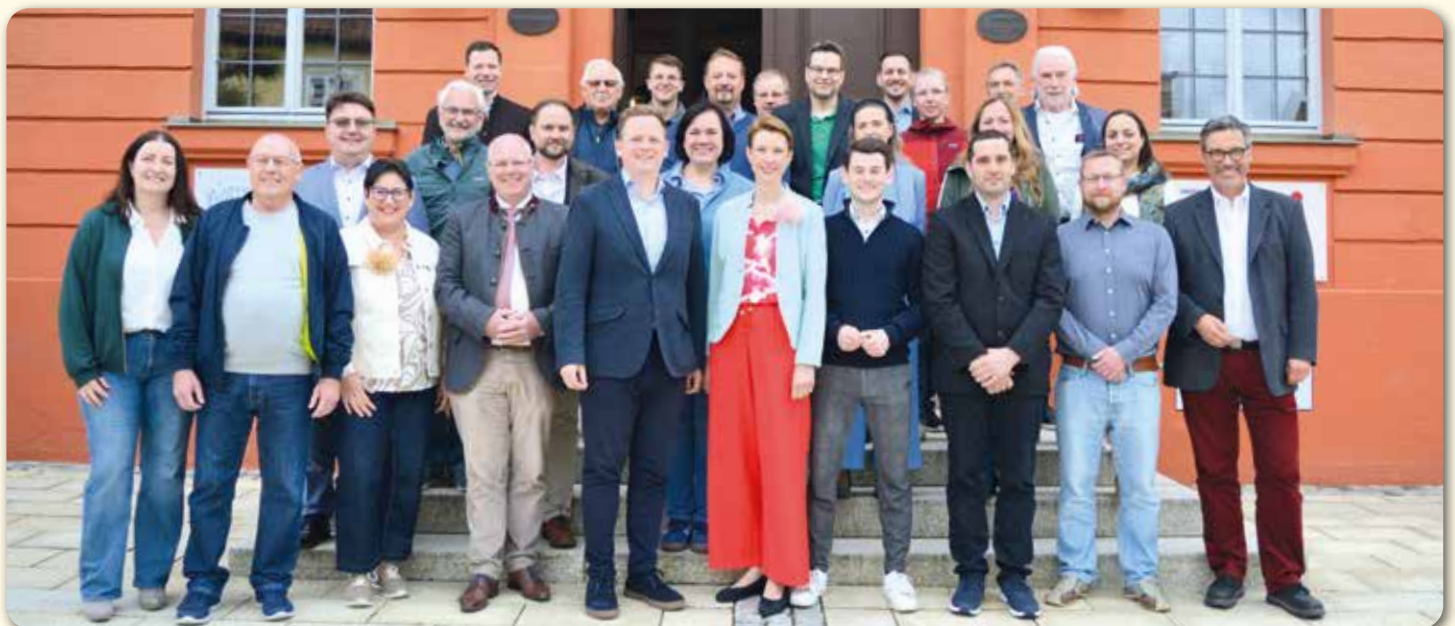
Stadt Bad Rodach, Neuer Stadtrat der Stadt Bad Rodach der Wahlperiode 2026 – 2032