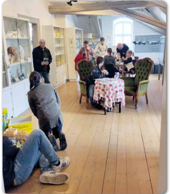
Der Spielenachmittag am Sonntag

Die mehr als 50 Ausflüge dienen als Bildungsfahrten zur Heimatgeschichte, wobei oft andere Museen besucht werden. Die bisher schon zahlreichen Führungen werden am zweiten Tage des Festwochenendes erneut angeboten. Zum neuen Schwerpunkt des Vereins, der Erinnerungskultur, zeigen sie besonders anhand einer neuen Gedenktafel am Rathaus und Stolpersteinen für vertriebene jüdische Familien die schlimme Verfolgung, aber auch den erfreulichen Widerstand gegen den Nationalsozialismus in Rodach auf.