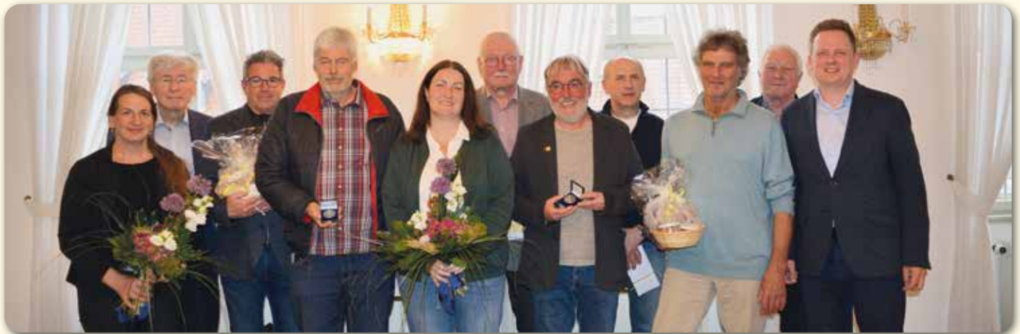
Stadt Bad Rodach, Verabschiedung der Stadträtinnen, Stadträte und Ortssprecher der Wahlperiode 2020 – 2026

Alternativ kann sich der Finder auch bei der Unteren Jagdbehörde (Montag bis Freitag jeweils vormittags) unter 09561/514-3105 melden.