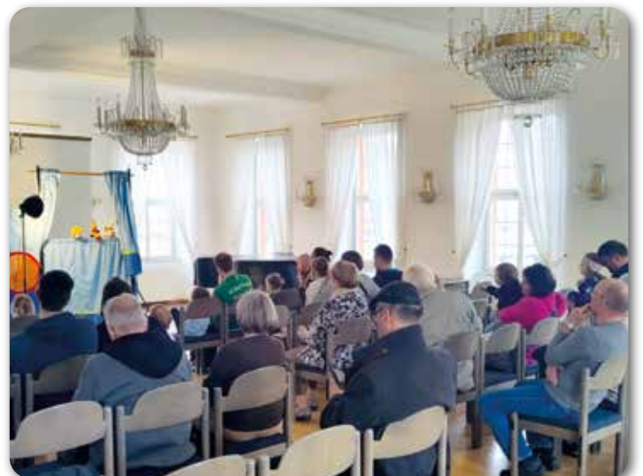
Das Kasperletheater am Sonntag

Zum Jubiläum ist auch eine „Kurz-Chronik Rückert-Kreis“ (Bad) Rodach erschienen. Sie steht als Download unter https://heimatmuseum-rodach.de/ zur Verfügung.