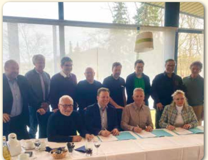
Die Kooperationspartner bei der Unterzeichnung des Vertrages.

Die ThermeNatur ist ein zentraler touristischer Anziehungspunkt und ein wichtiger Wirtschaftsfaktor für das Coburger Land. Mit der Kombination aus langfristiger Zusammenarbeit und gezielten Investitionen wird ihre Wettbewerbsfähigkeit nachhaltig gestärkt und der Standort zukunftssicher aufgestellt.