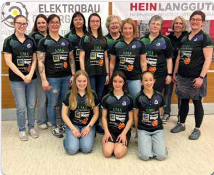
3. Damenmannschaft, Meister der Bezirksklasse A und Aufsteiger in die Bezirksoberliga mit allen eingesetzten Spielerinnen.

Mit den Erfolgen im Nachwuchs, dem gesicherten Klassenerhalt der 1. und 2. Damenmannschaft, dem Aufstieg der 3. Damen sowie der außergewöhnlich hohen Zuschauerbeteiligung zieht der TSV Bad Rodach eine durchweg positive Saisonbilanz. Der Verein sieht sich sportlich wie strukturell hervorragend aufgestellt und blickt optimistisch auf die kommenden Spielzeiten. Die nächste Generation steht bereits in den Startlöchern – beste Voraussetzungen dafür, dass der TSV Bad Rodach auch künftig eine bedeutende Rolle im bayerischen und überregionalen Tischtennisport spielt.