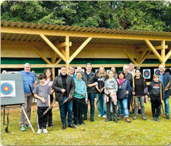
Zur Einweihung durften sich auch die Ehrengäste am Bogen beweisen

Kürzlich wurde die Anlage um eine neue Überdachung im Bereich der Zielscheiben erweitert, um zusätzliche Sicherheit und Komfort zu bieten. Bernd Lutter und Gabi Armann aus Bad Rodach kümmern sich um's Organisatorische. Alle Interessierten sind herzlich eingeladen die nette Gruppe im Waldbad kennenzulernen und unverbindlich auszuprobieren, ob Intuitives Bogenschießen auch für Sie ein attraktiver Freizeitsport sein könnte. Für Rückfragen steht Ihnen Frau Gabi Armann (Mobil: 0171 7604532 oder per E-Mail: gabi@armann.me) gerne zur Verfügung.