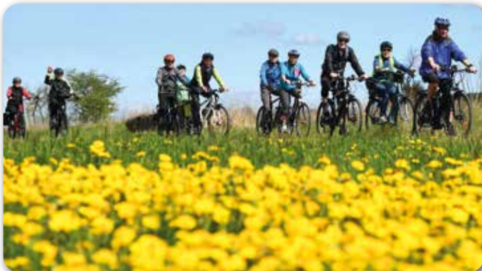
„Das Anradeln gehört zu den Aktionen der Initiative Rodachtal, die das Rodachtal als attraktive Freizeitregion erlebbar machen.“

Für das leibliche Wohl sorgt der 1. Birkenfelder Traditionsverein, der mit Bratwurst, Pizza, Zwiebelkuchen und selbst gebackenen Kuchen zugleich die 25. Backhaussaison eröffnet. Kinder erwartet ein abwechslungsreiches Programm mit Hüpfburg und Spielmobil. Einen besonderen Service bietet der ADFC Südthüringen an: Vor Ort können Fahrräder gegen eine kleine Gebühr codiert werden. Dafür müssen Identitäts- und Eigentumsnachweis mitgebracht werden.